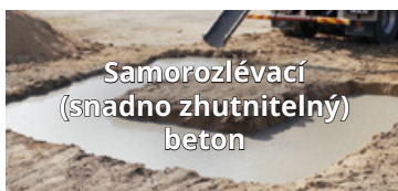
Samorozlévací (snadno zhutnitelný) beton