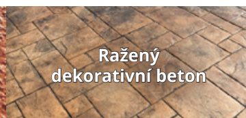
Ražený dekorativní beton