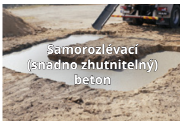
Samorozlévací (snadno zhužnatelný) beton