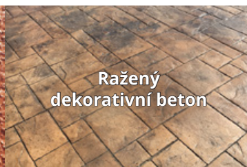
Ražený dekorativní beton