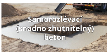
Samorozlévací (snadno zhutnitelný) beton