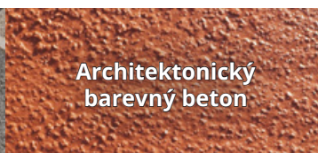
Architektonický barevný beton