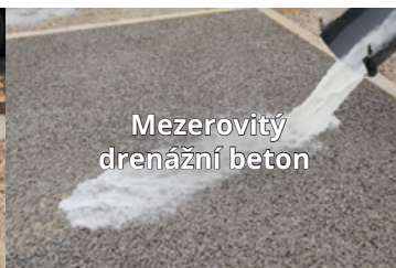
Mezerovitý drenážní beton