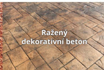
Ražený dekorativní beton