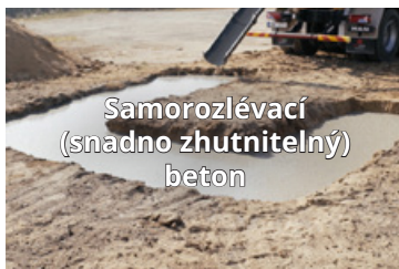
Samorozlévací (snadno zhužnatelný) beton