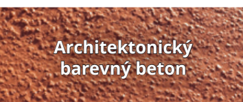
Architektonický barevný beton