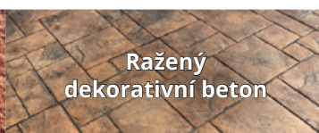
Ražený dekorativní beton