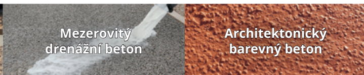
Mezerovitý drenážní beton