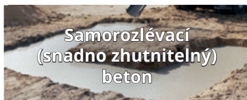
Samorozlévací (snadno zhutnitelný) beton