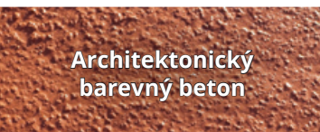
Architektonický barevný beton