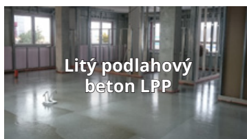
Litý podlahový beton LPP