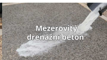
Mezerovitý drenážní beton