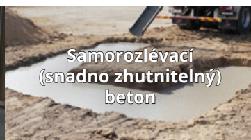
Samorozlévací (snadno zhutnitelný) beton