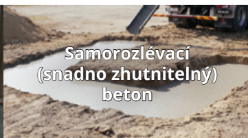
Samorozlévací (snadno zhutnitelný) beton